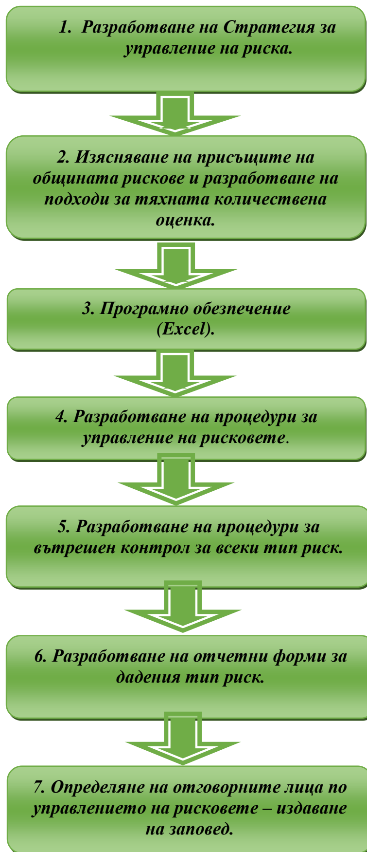
Фиг. 1. Алгоритъм на управлението на риска.